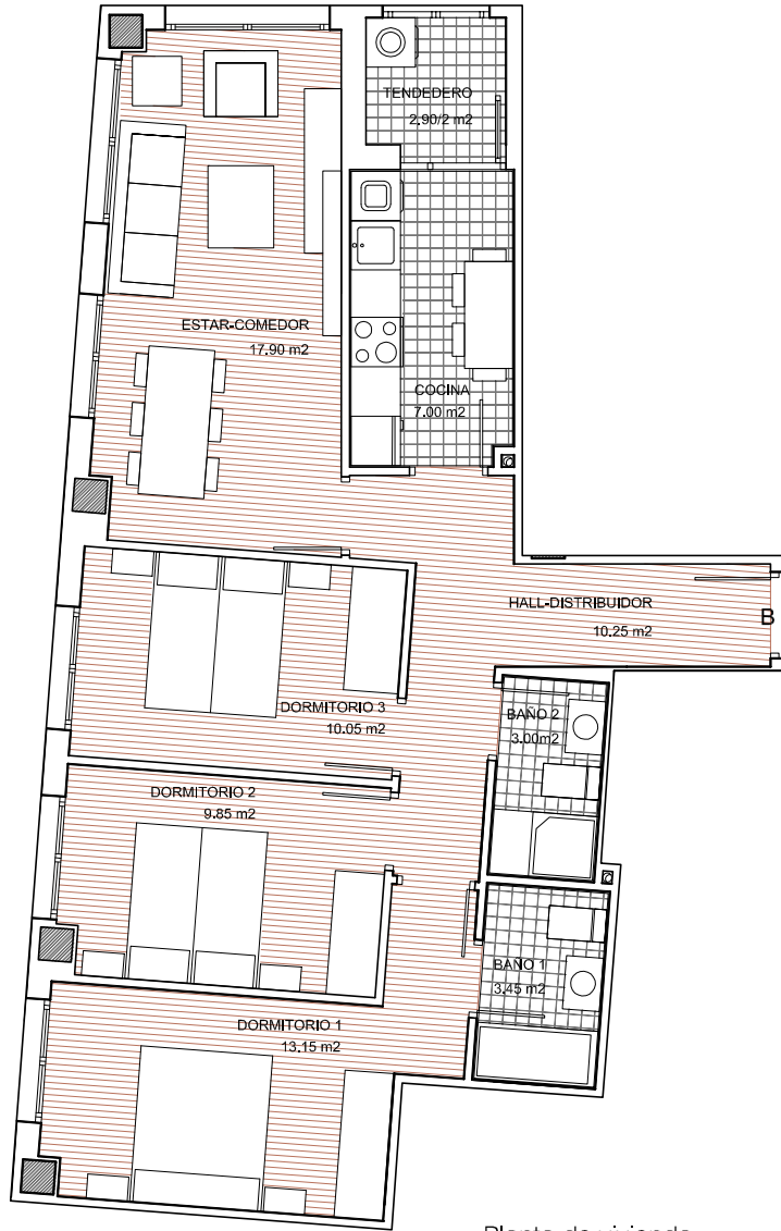
Planta de vivienda