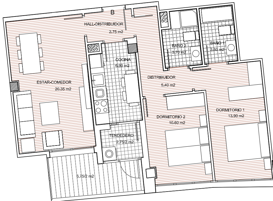
Planta de vivienda